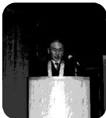
挨拶される播磨清水寺御山主