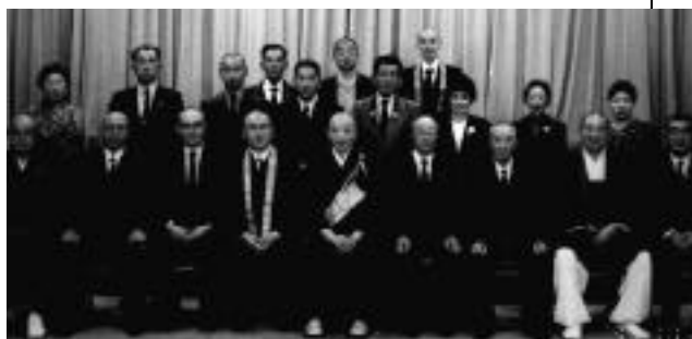
出席者の記念写真